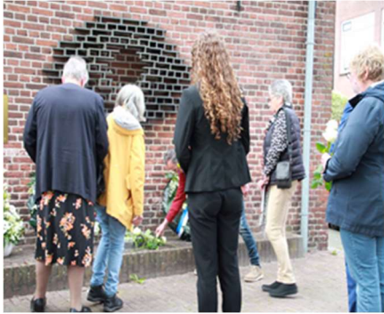
Na de Jom Hasjoa herdenking werden 10 witte rozen bij het monument gelegd.